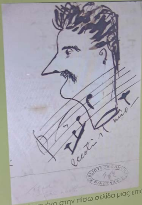
Αυτοπορτραίτο σχεδιασμένο στην πίσω σελίδα μιας επιστολής προς τον λιμπρεττά Ιλλίσα το 1895.